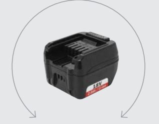
BATTERI 18 V / 2,0 Ah Li-ion Vægt: 0,37 kg. Opladningstid: 45 min. VNR. 49500