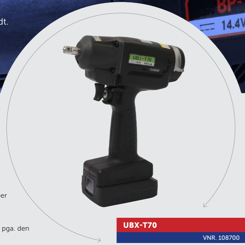
UBX-T70 VNR. 108700