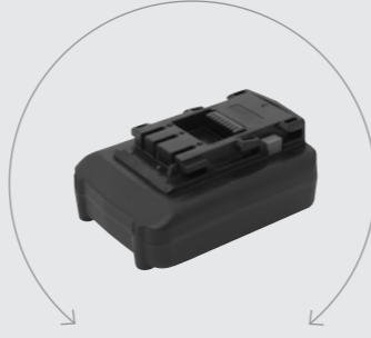
BATTERI 10,8 V / 2,0 Ah Li-ion Passer til: BP-T50 Vægt: 0,34 kg. VNR. 898600