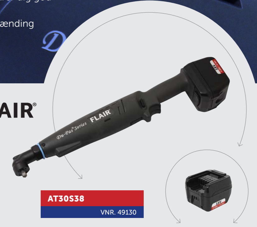
AT30S38 VNR. 49130