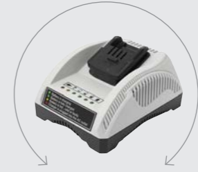
OPLADER FOR PT/AT Vægt: 0,50 kg. VNR. 49520