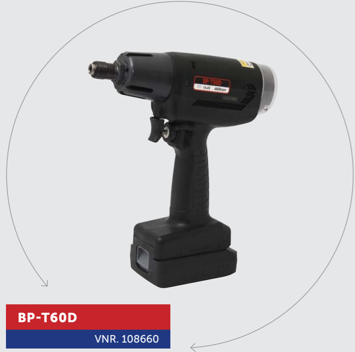
BP-T60D VNR. 108660