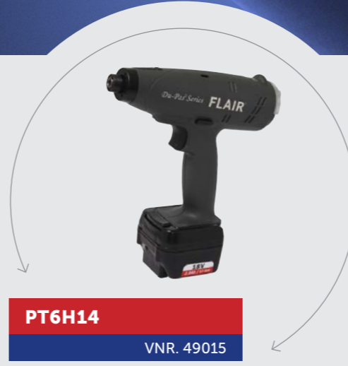
PT6H14 VNR. 49015

FLAIR er Folke-Larsens eget brand. Det sikrer dig god kvalitet til rimelige priser. Denne serie er velegnet til præcisionstilspænding ved hård samt blød forbandt.