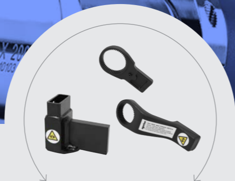
EKSEMPLER PÅ MODHOLD